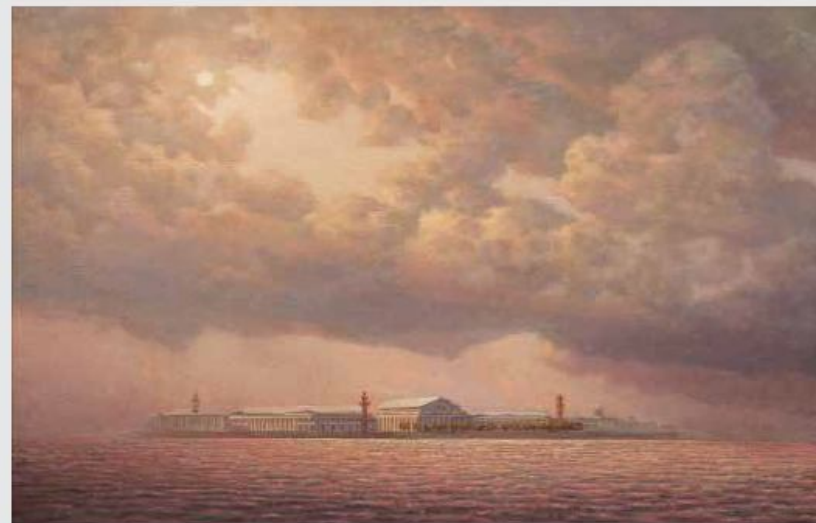
002. Васильевский остров. к/м, 60х80, 2000 Vasilievsky Island. c/o, 60x80, 2000