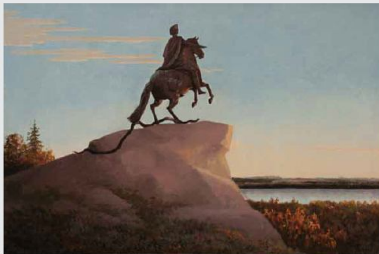
001. Здесь будет город заложен. к/м, 60х80, 2000 There will be a city laid. c/o, 60x80, 2000